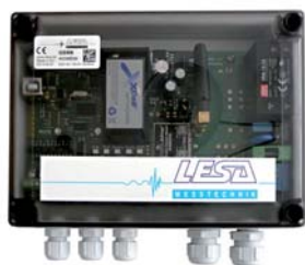
LESA- GSM 8