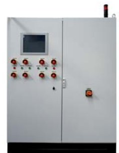
PLC TOUCH Grossanlage