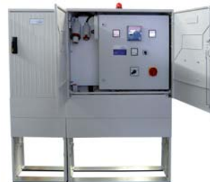
Kompaktschaltschrank mit Noteinspeisung und EVU-Anschluß