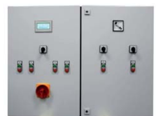
PLC TOUCH-System Kompaktschrank