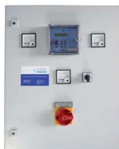
Kompaktschaltschrank LCD2 - System Metall