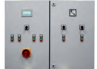
PLC TOUCH-System Kompaktschrank