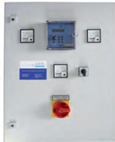
Kompaktschaltschrank LCD2 - System Metall