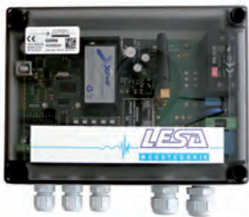
LESA- GSM 8