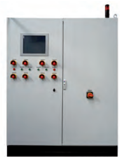
PLC TOUCH Grossanlage