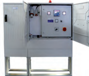
Kompaktschaltschrank mit Noteinspeisung und EVU-Anschluß